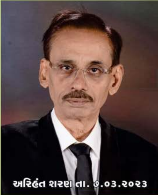
અરિહંત શરણ તા. ૭.૦૩.૨૦૨૩