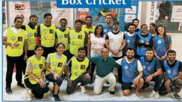
Runners up & Winners of Box cricket